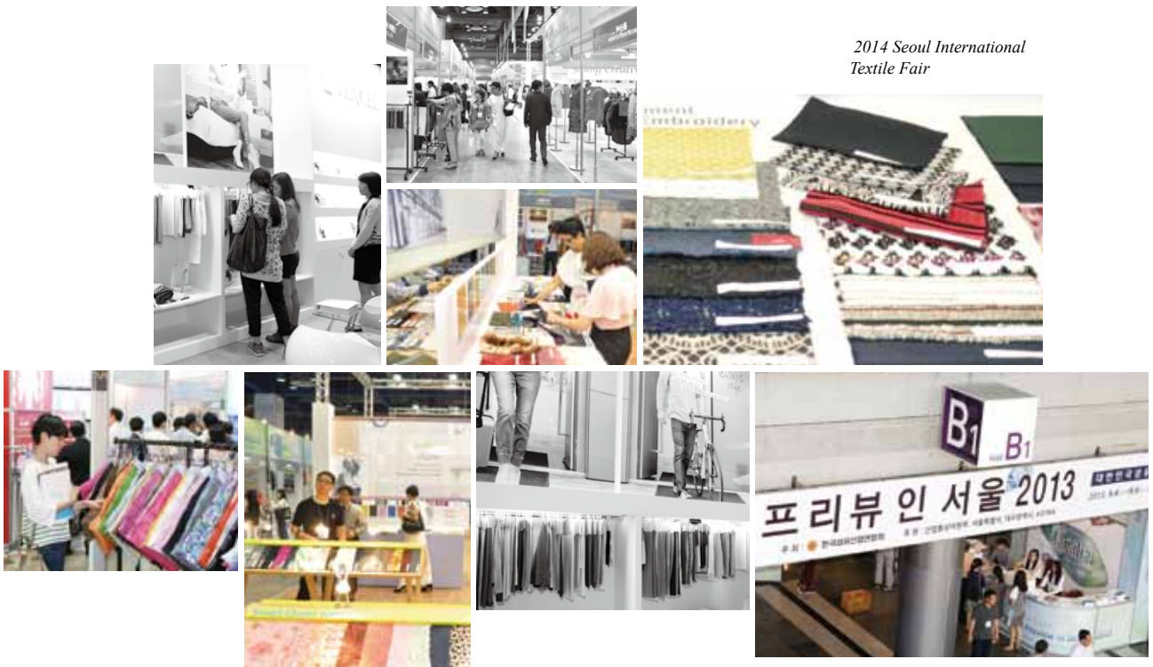
2014 Seoul International Textile Fair